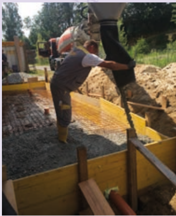
Baustelle Anbau für Küche und Lagerraum